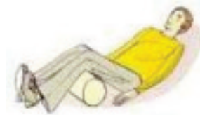
Position sur le dos, jambe fléchie Plaie du ventre (abdomen)