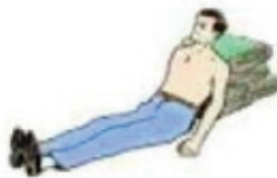
Position demi assis Plaie du thorax